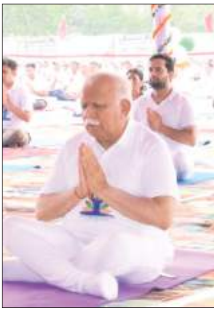
हरियाणा के सीएम मनोहर लाल खट्टर योगाभ्यास करते हुए।